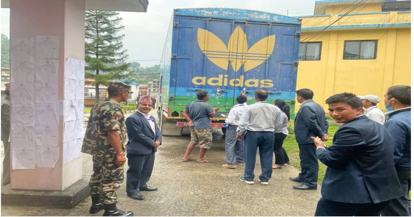
गुल्मी जिल्लाको विकट मतदानस्थल मदाने गाउँपालिकाको अग्लुङ्ग पुग्दै गर्दाका तस्वीरहरु

स्थानीय तह चुनाव २०७९ को लागि सुरक्षित रुपमा मतपत्र मुख्य निर्वाचन अधिकृतको कार्यालयमा ढुवानी गरिएको ।