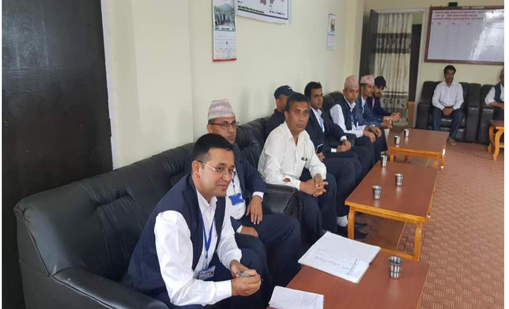
नियमिति स्टाफ बैठक