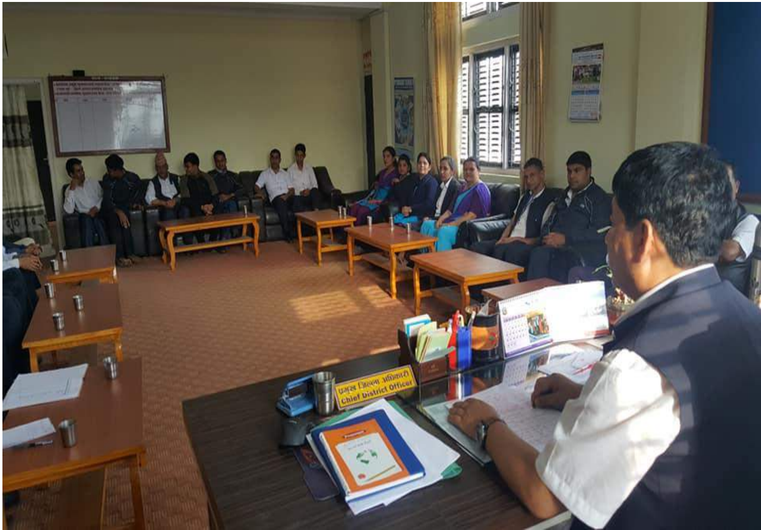
नियमिति स्टाफ बैठक