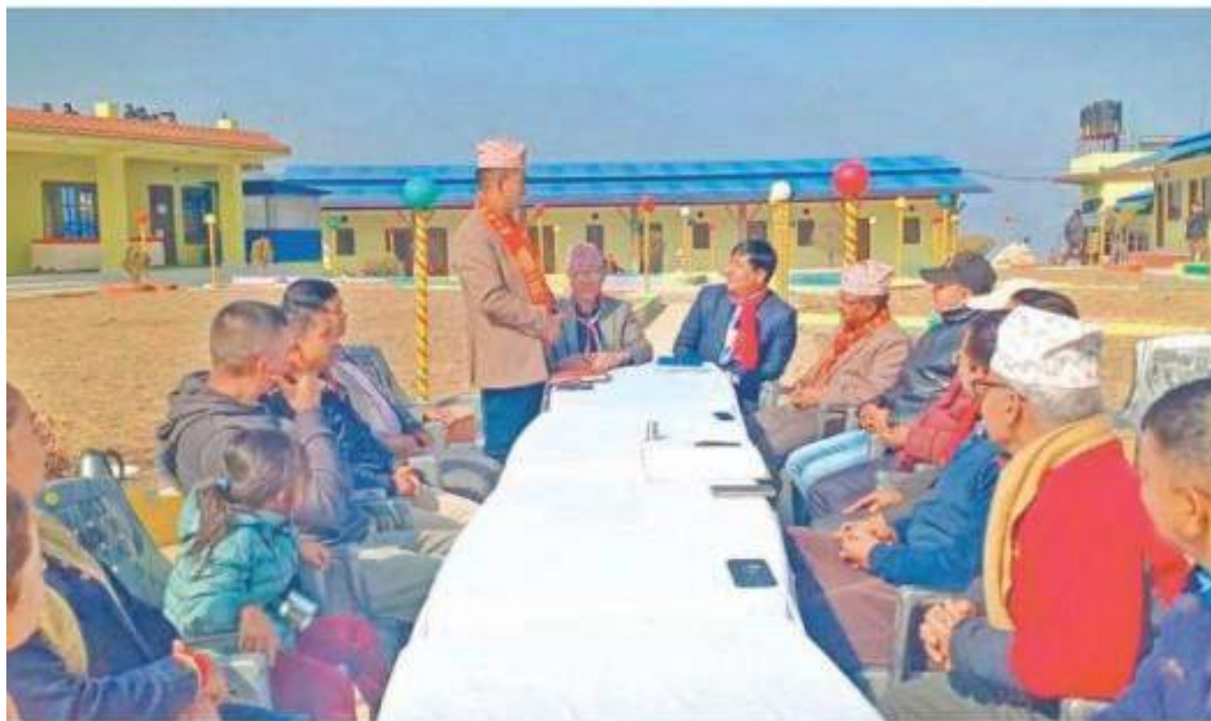
समितिको समूह बैठक । दुई जिल्लाको सीमाका हुन सक्ने आपसीगत गतिविधि नियन्त्रण गर्ने, स्वामीपक्षीको नियन्त्रण तथा आपसी भौभागदुलागपगत विषयमा सहकार्य गरेर समाधान निकाल्ने, दुर्घटना र अपांडीको नरगामीमा सामाजिक इलेको बैठकले गरेको छ ।