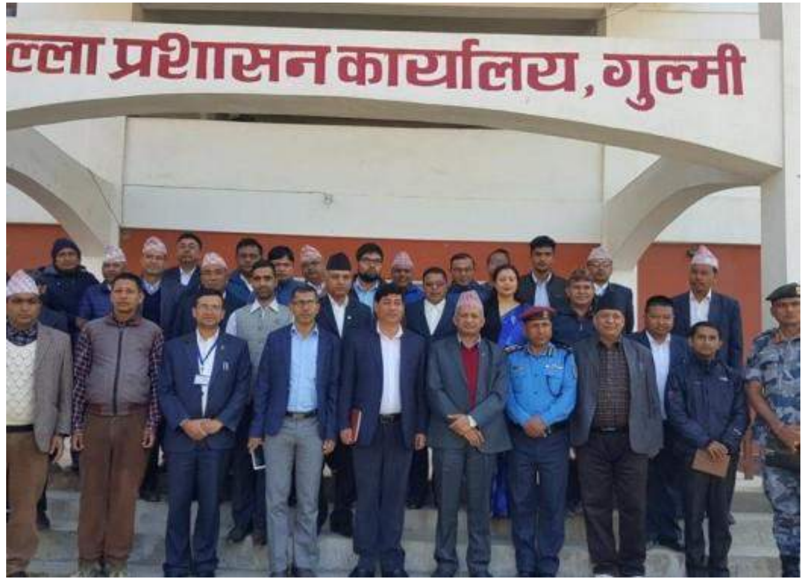
माननीय परपरराष्ट्र मन्त्री श्री प्रदीप कुमार जवालीज्यूसँग प्रजिअ लगायत जिल्लास्थित कार्यालय प्रमुखहरु