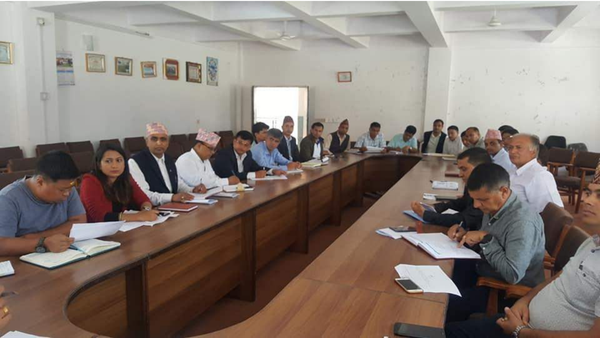
कार्यालय प्रमुखहरुको बैठक