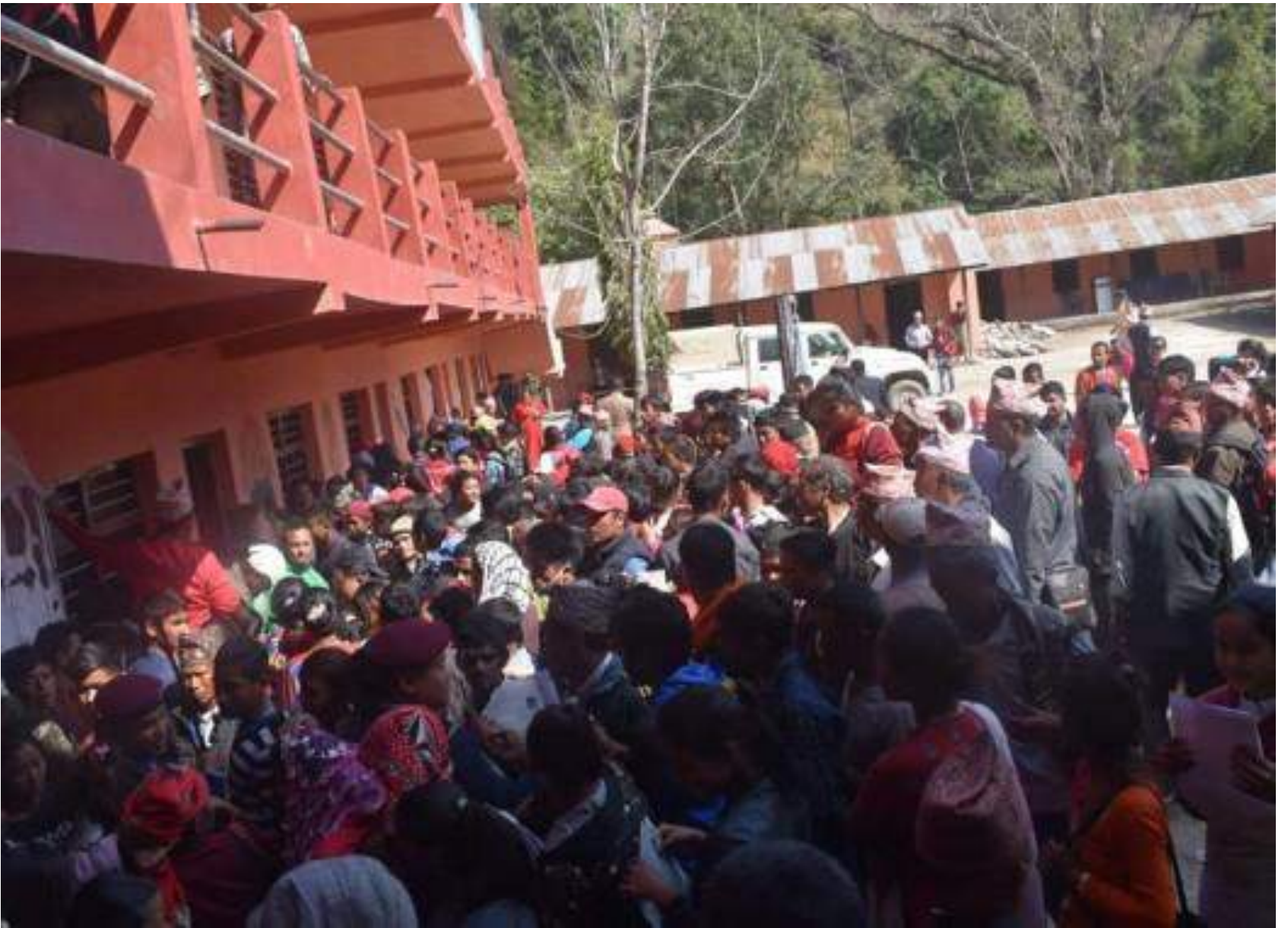
एकीकृत घुम्टि शिविरमा नागरिकहरु